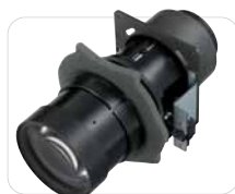
VPLL-Z1024 Óptica con zoom (2,38 - 3,26:1)