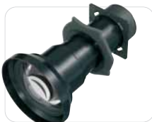
VPLL-1008 *** Corto alcance (0,78:1)