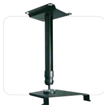
PSS-610NL Soporte de montaje en techo