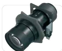
VPLL-Z1032 Óptica con zoom (3,24 - 4,95:1)