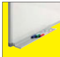
La bandeja portarotuladores se instala facilmente sin necesidad de herramientas