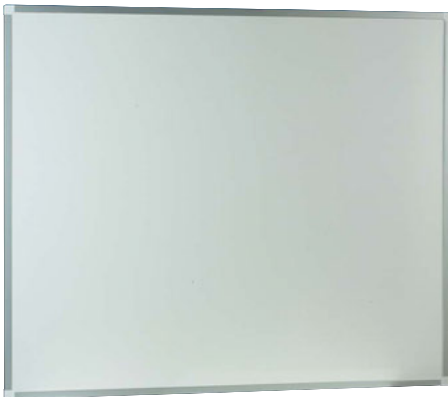
PIZARRAS PARA ROTULADOR A-1

Incluye una bandeja portarotuladores de aluminio de 30 cm de longitud. Disponible también como accesorio en los siguientes longitudes: 30, 60, 90, 100, 120, 150, 200, 244, 300, 366, 400, 500 y 600 cm.