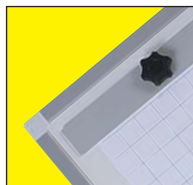
Portabloc de aluminio para adaptar blocs de papel. (Accesorios opcional)