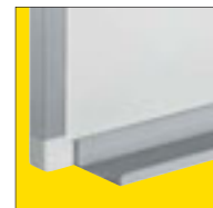
La bandeja portarotuladores se instala fácilmente sin necesidad de herramientas