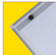
Portabloc de aluminio para adaptar blocs de papel.